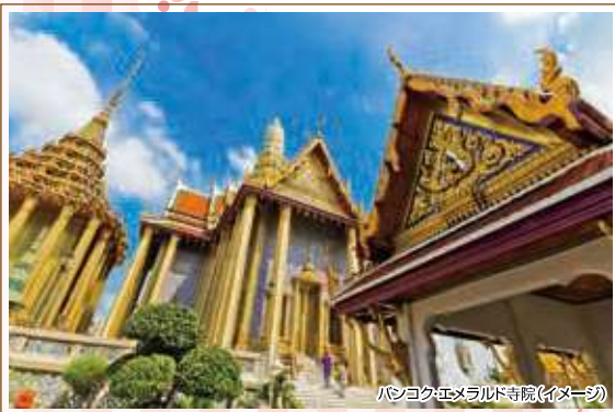
バンコクエメラルド寺院(イメージ)