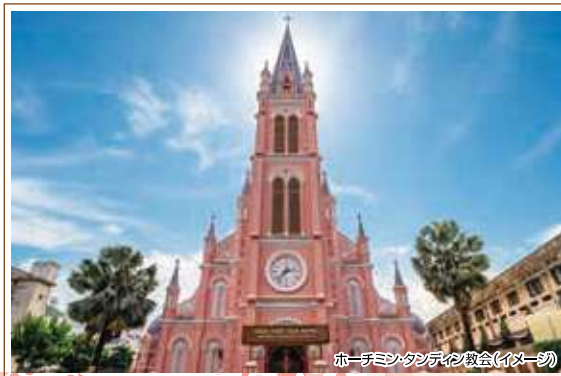
ホーチミンタンテイ教会(イメージ)