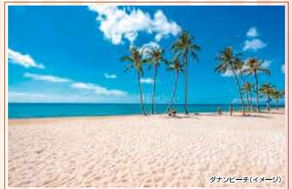
ダナンビーチ(イメージ)