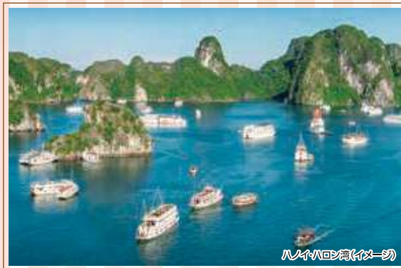
ハノイハロン湾(イメージ)