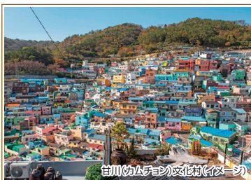
甘川(カムチョウ)文化村(イメーシ)