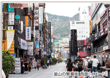
釜山の繁華街(西面)イメーシ