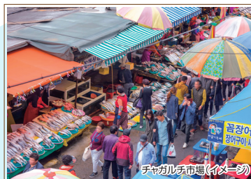
チャガルチ市場(イメーシ)