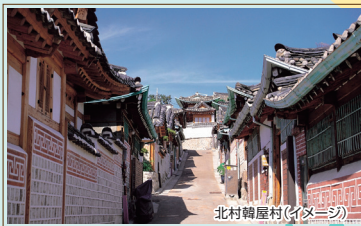
北村韓屋村(イメージ)

■旅行代金(お一人様:2名1室) ソウル3日間(仁寺洞クラウン利用)の場合 54,800円~131,800円 ※燃油サーチャージ目安往復18,400円(6月20日以降)を別途お支払いください。但し、今後改訂となった場合は差額を精算させていただきます。また、海外空港諸税が別途必要です。 ※令和8年7月1日以後に出国する旅行者から国際観光旅客税が、おひとり1,000円から3,000円に引き上げられます。当社のツアーでは7月22日以降にご出発されるお客様に適用となります。