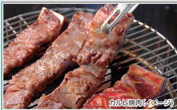
カルビ焼肉(イメージ)