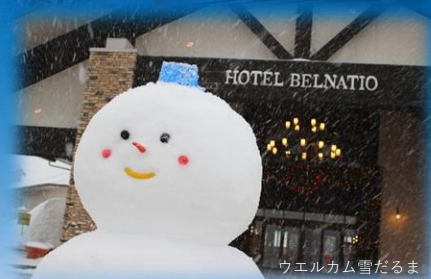
ウエルカム雪だるま