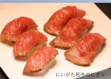
にいがた和牛のにぎり