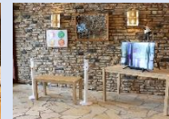
个ウォークイン検温