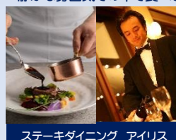
ステーキダイニング アイリス

buffeの他にも、夕食がございます(事前予約制) 静かな雰囲気の中で食べるステーキダイニングと和食処