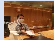
个飛沫ガードの設置