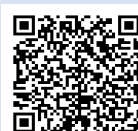
个取組の最新情報